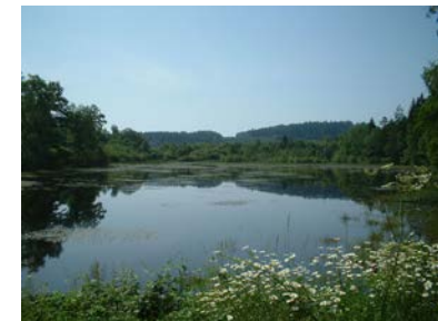
Etang de Faux-la-Montagne