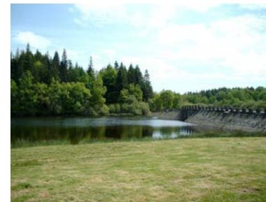
Vue sur la digue