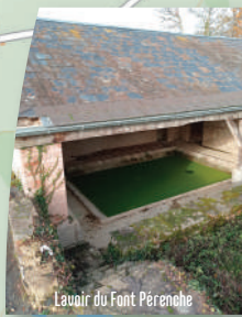
Lavoir du Font Pèrenche

Téléchargez ce parcours en scannant ce qr code >