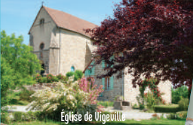
Église de Vigeville